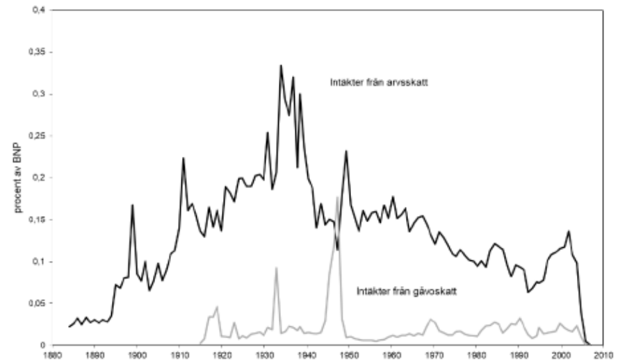
Figur 2.2 Intäkter från arvs- och gåvoskatt som andel av BNP, 1884–2008